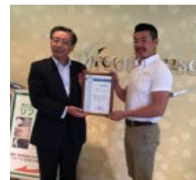
水谷ペイント社長認定式